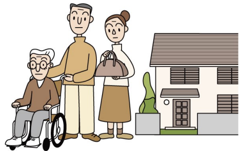
介護等のための親族との同居